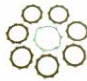
KIT DISQUES D'EMBAYAGE GARNIS + JOINT COUVERCLE D'EMBAYAGE (2002/2020)