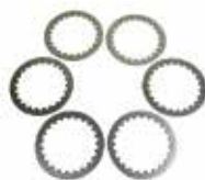
KIT DISQUES D'EMBAYAGE EN ACIER (2002/2020)