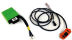
BOÎTIER CDI (2019/2020)