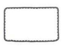
CATENA DI DISTRIBUZIONE