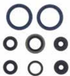
SERIE PARAOILIO MOTORE