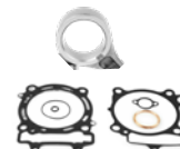
EASY CYLINDER KIT 2016-2018