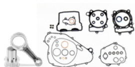
EASY ROD KIT 2016-18