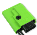
CENTRALITA RX1 PRO 2018