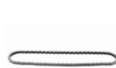
CADENA DE DISTRIBUCIÓN 2009-2018