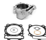
EASY CYLINDER KIT 2016-2018