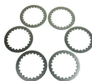
KIT DISCOS DE EMBRAGUE EN ACERO (2002/2020)