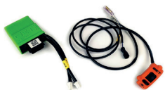
CENTRALITA CDI (2019/2020)