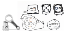
EASY ROD KIT 2016-18