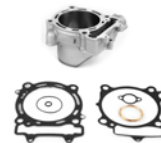
EASY CYLINDER KIT 2016-2018