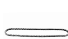
CHAINE DE DISTRIBUTION 2009-2018